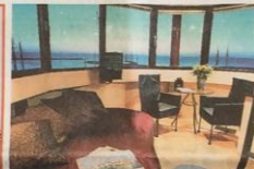
Boven: Het interieur van de tot hotel verbouwde vuurtoren van Harlingen. Het hotel beschikt slechts over één tweepersoons gastenkamer van waaruit men een schitterend uitzicht heeft over het Wad en de stad.