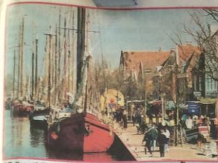
Tallose tjalken en klippers hebben Harlingen als thuishaven.